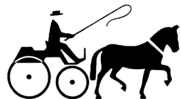
Tablet for beregning af etapetider 4,5 km/t til 11 km/t