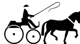
Tablet for beregning af etapetider 12 km/t til 20 km/t